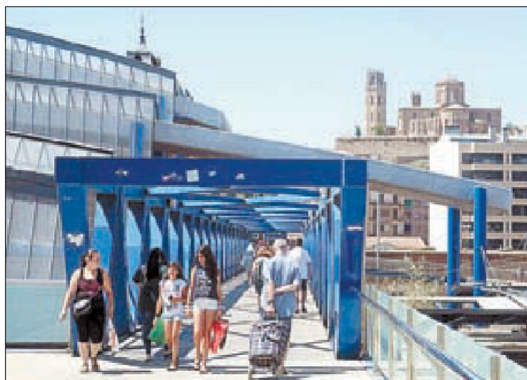
Peatones cruzando la pasarela que será renovada

Los trabajos se abordarán mayoritariamente por la noche, con el objetivo de minimizar las molestias a los vecinos y vecinas, desde las 23 de la noche hasta las 7 de la mañana de domingo, 10 de julio, y jueves, 14 de julio. Durante estas dos noches se interrumpirá el paso de peatones por